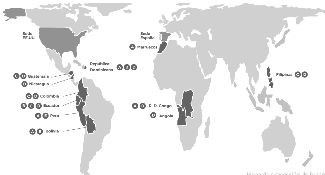
Mapa de proyección de Peters